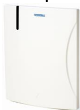
HF500-Cotag V24246-F4106-A1 Utgår